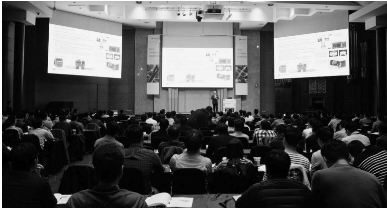
키사이트 5G 및 mmWave 워크샵 전경