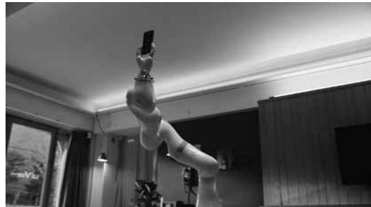
쿠카의 세계 최초 인간 협동로봇 LBR 이바 포토그래퍼로 변신

제4차 산업혁명을 이끄는 두 주역인 쿠카의 인간 협동로봇(HRC) 'LBR 이바(iiwa)'와 인공지능(AI) 기능이 탑재된 LG전자의 'LG V30S 씽큐(ThinQ)' 스마트폰이 만났다.